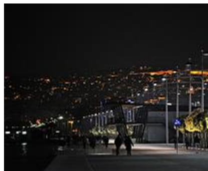
Řecko: Nová promenáda Thessaloniki

Výhradní dovozce pro ČR: DEMA DEKOR CZ s.r.o. Kotkova 710/3, 66902 Znojmo tel: +420 515 227 272, office@dema-dekor.cz www.dema-dekor.cz