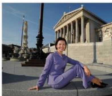
Rakousko: Parlament Wien