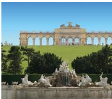
Rakousko: Gloriette Wien