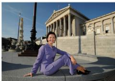
Rakousko: Parlament Wien