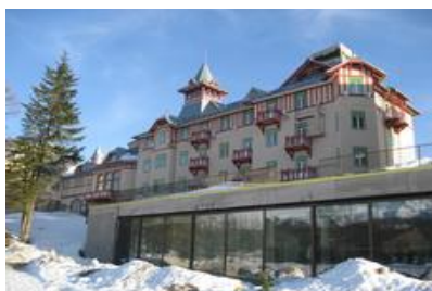
Slovensko: Grand Hotel Kempinski Vysoké Tatry