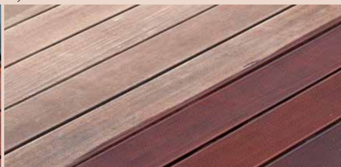
ošetření CC-Bangkirai olej